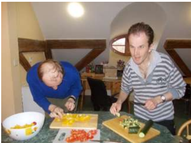
Oslavy narozenin a svátků